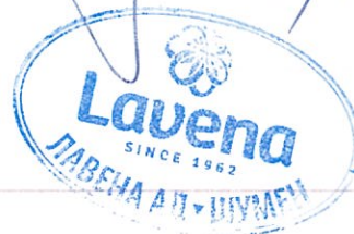
Галина Дишовска - Прокурист